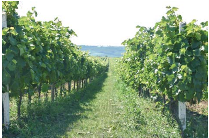
Figura 13. Plantație de vita de vie înierbată