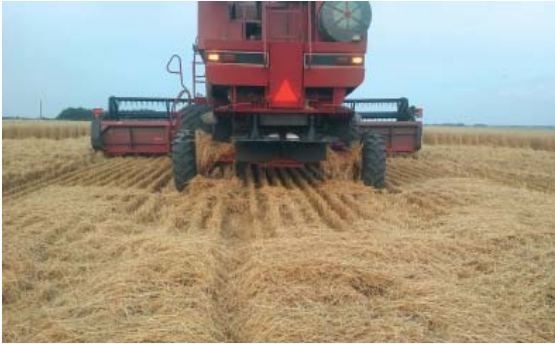
Figura 4. Gestionare incorectă a reziduurilor de grâu