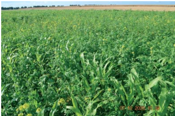
Figura 6. Culturile de acoperire pot opri buruienile