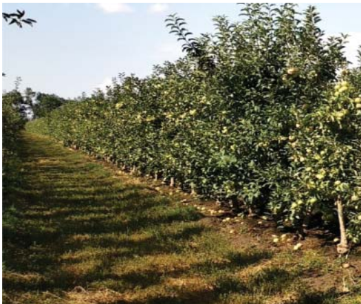
Figura 12. Livadă de măr înierbată