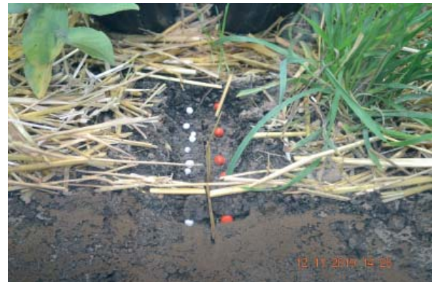
Figura 7. Plasarea optimă a semințelor și îngrășămintelor

Măsurile chimice. Erbicidele sunt o parte integrală a MIB și încă mult timp vor rămâne o unealtă eficientă în combaterea buruienilor în Agricultura Conservativă. Bunele practici de aplicare a erbicidelor includ: