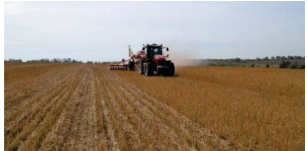
Figura 11. Semănatul în condiții de no-tillage

A începe implementarea pe o suprafață de teren mică înseamnă a supune unui risc toată gospodăria fermierului. Mărimea suprafeței de teren trebuie să fie suficientă pentru a observa beneficiile de la implementarea sistemului. Fermierul ar putea să înceapă cu o suprafață de 5% din gospodărie (presupunem că gospodăria este de aproximativ 1000 de ha) în primul an.