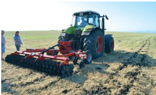
Figura 9. Distrugerea „tălpilor plugului”