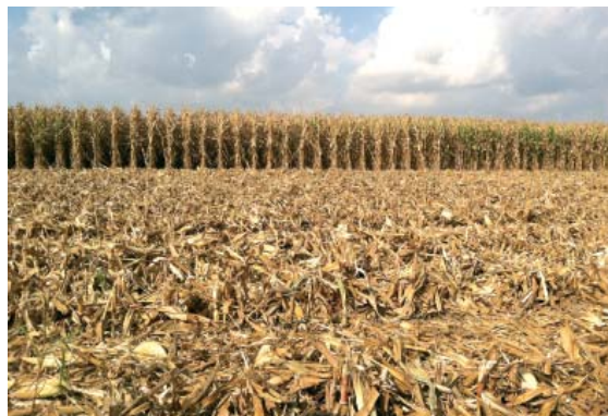
Figura 10. Cantitate sporită de reziduuri vegetale

Aproape toate avantajele sistemului no-tillage derivă din acoperirea permanentă a solului și numai câteva de la alte combinații de practici. Sporirea cantității de biomasă produsă se bazează pe alegerea culturilor în asolament care produc cantități mari de biomasă, cum este porumbul, grâul și alte culturi, în loc de a cultiva culturi cu cantități mici, cum este soia, linteaa și alte culturi.