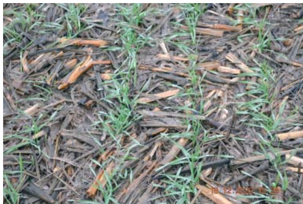
Figura 3. Răsăritul grâului de toamnă semănat în reziduurile de porumb

Perturbarea mecanică minimă a solului (semănatul și plasarea îngrășămintelor în condiții de no-tillage), este principiul care este cel mai greu de înțeles și cel care determină într-o oarecare măsură caracterul investiției inițiale la procurarea echipamentului. Principiul „perturbarea minimă a solului” nu trebuie confundat cu termenul „minimalizarea lucrării solului” și nici cu termenul „mini-till”. Semănatul în condiții de no-tillage (sau semănatul direct), utilizat ca procedeu singular, fără respectarea tuturor principiilor, nu este considerat Agricultură Conservativă. Acest principiul, care în practică este realizat cu semănători special construite, pentru a plasa semințele și îngrășămintele, asigură o perturbare minimă a solului.