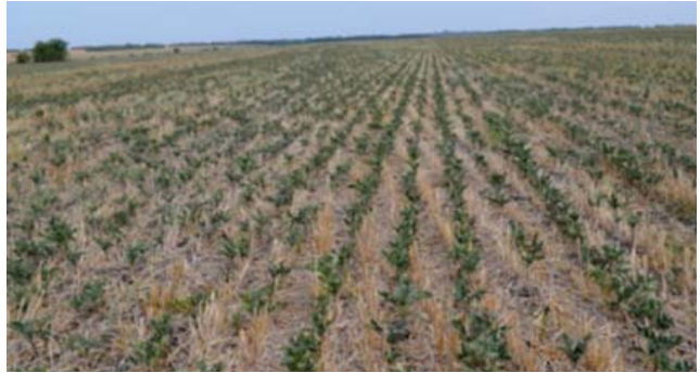
Figura 5. Muștar în calitate de cultură de acoperire pură