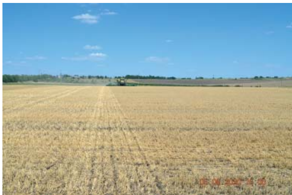
Figura 2. Semănatul și plasarea îngrășămintelor în condiții de no-tillage